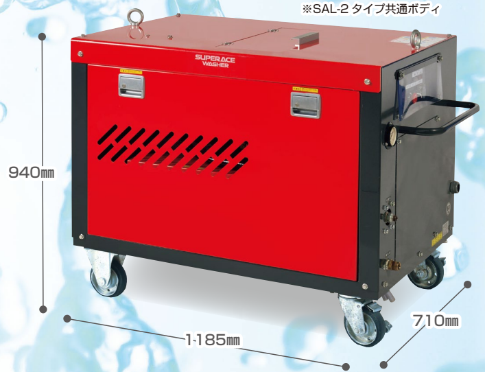
※SAL-2 タイプ共通ボディ