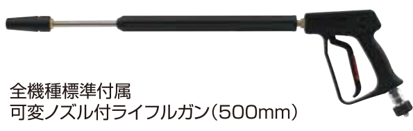
全機種標準付属 可変ノズル付ライフルガン(500mm)