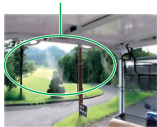
ポンプ・水タンク位置